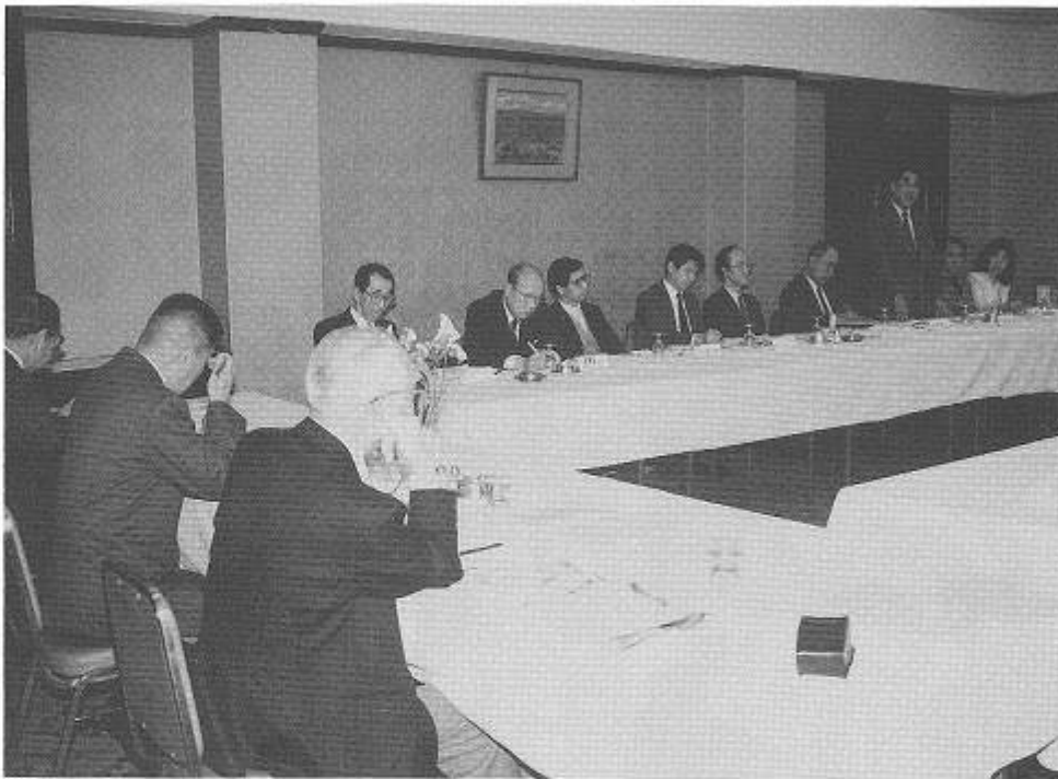
幹事会 4月13日 学士会館