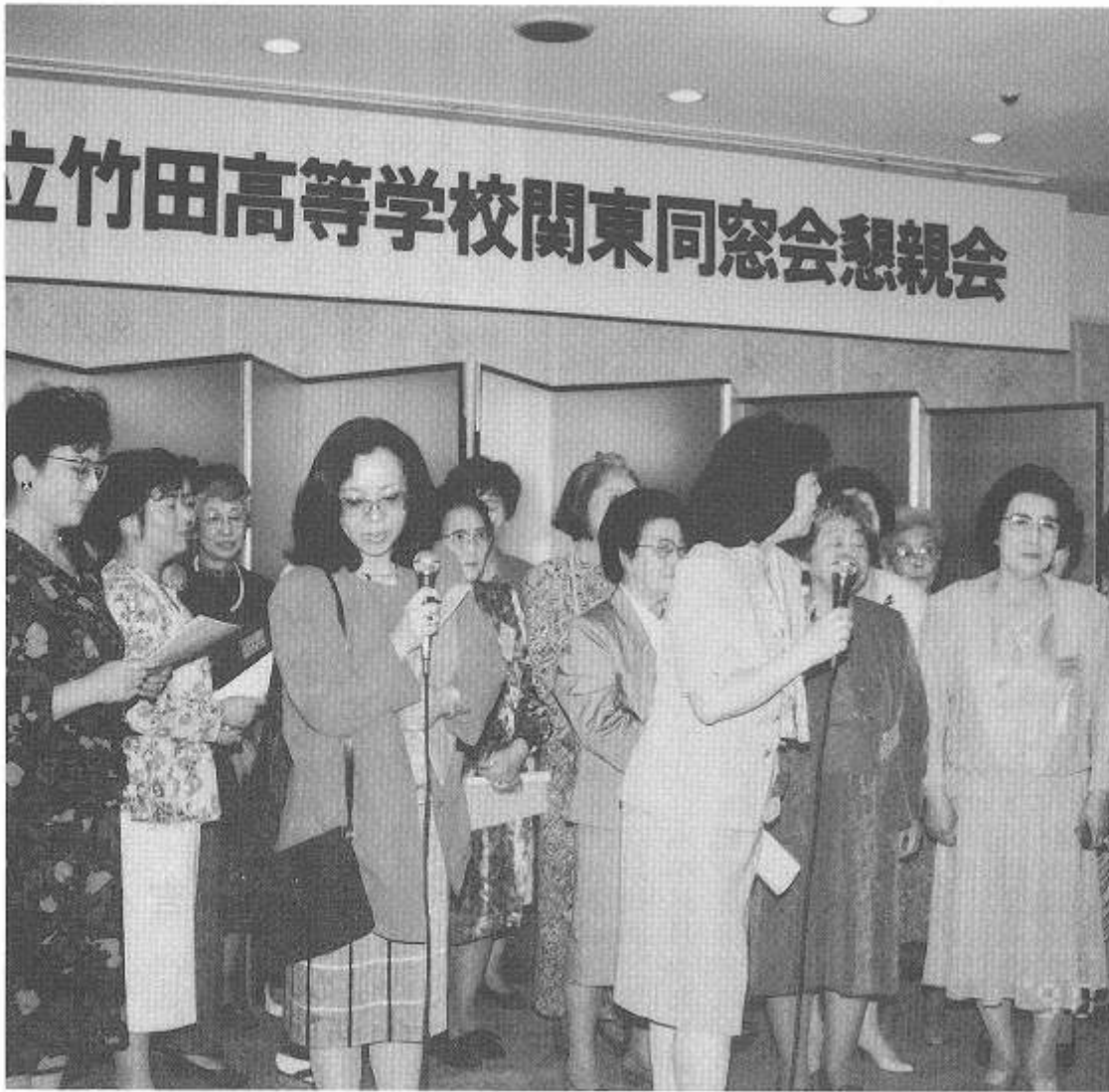
立竹田高等学校関東同窓会懇親会