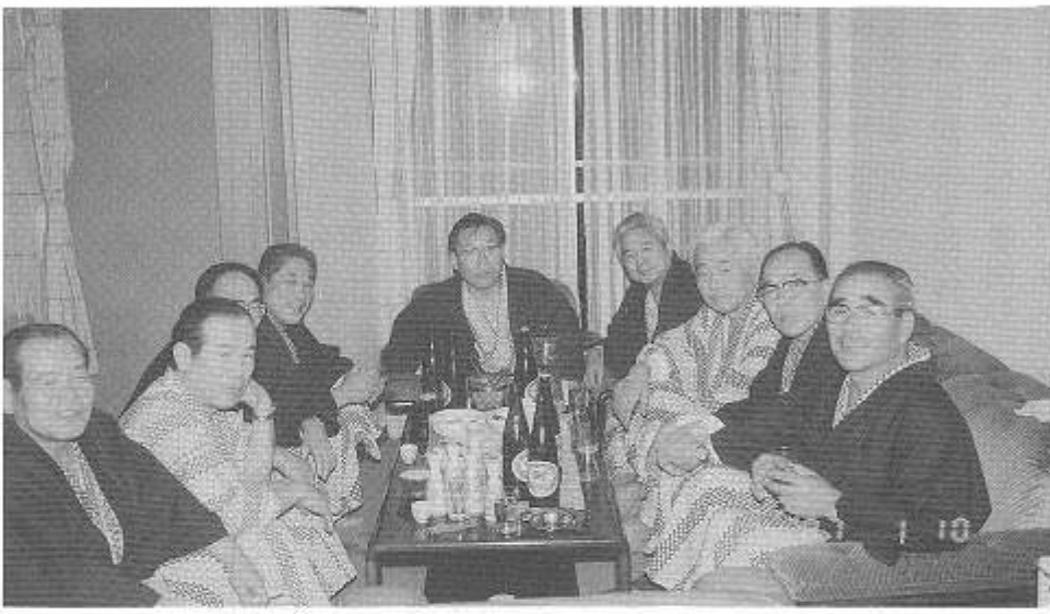
(箱根でのクラス会)

最近、私が上京した当時からみると、すべてにわたつて隔世の感。物産展もあるし、宅急便で送りつけてもくれるし、いながらにして故里の香りを味わうことができる。